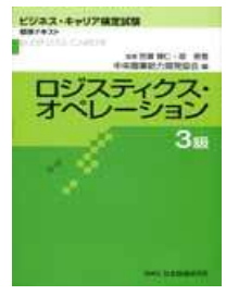
『ロジスティクスオペレーション3級』標準テキスト使用。