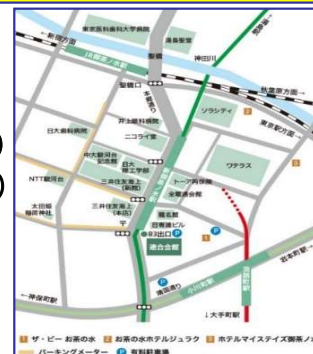
連合会館までの地図